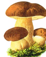
Für die Jugend | Deutschland Pilze – Echter Steinpilz 85 + 40 2018