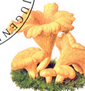
Für die Jugend | Deutschland Pilze – Echter Pfifferling 70 + 30 2018