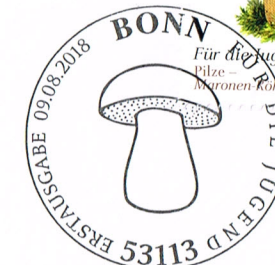
Für die Jugend | Deutschland Pilze – Maronen-Röhrling 145 + 55 2018